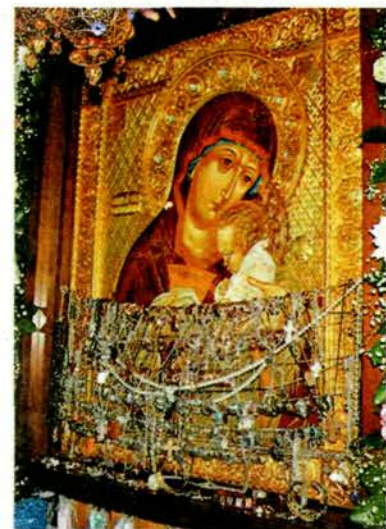
Икона увешана золотом прихожан.

Участвуйте в опросе на сайте www.kuzbass.aif.ru